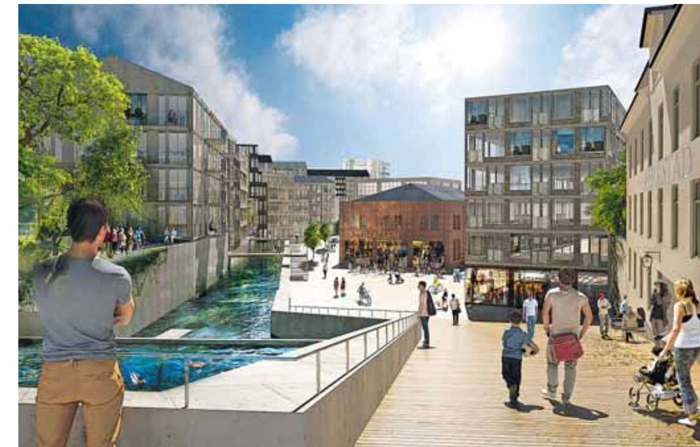
Forsetorget är arbetsnamnet på den plats som är starkast präglad av industrihistorien och kan bli en given mötesplats för kulturella och kommersiella verksamheter. Bilden visar att Mölndalsån har en central roll i den nya stadsdelen.

Just nu pågår rivnings- och saneringsarbeten samtidigt som byggnader som ska bevaras förses med provisoriska tak. Nästa år förväntas en första av minst tre detaljplaner