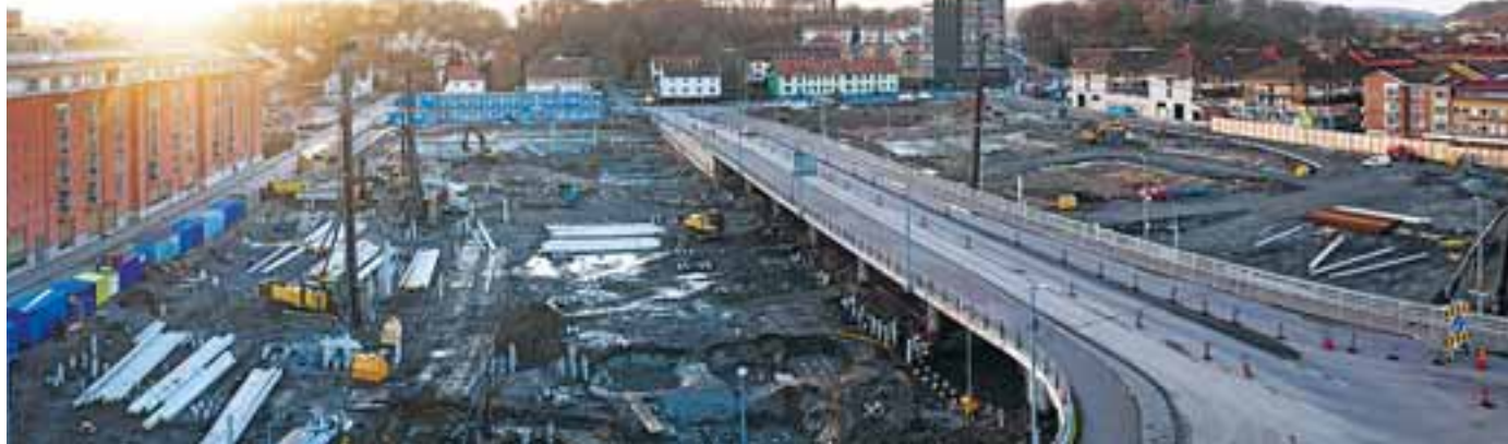
Äntligen händer det! Nu bygger vi Mölndals innerstad. Här kommer det 2018 finnas både bostäder, en helt ny galleria, nytt stadsbibliotek och spännande mötesplatser.

Det vill säga lägenhetsbyten från hyres-