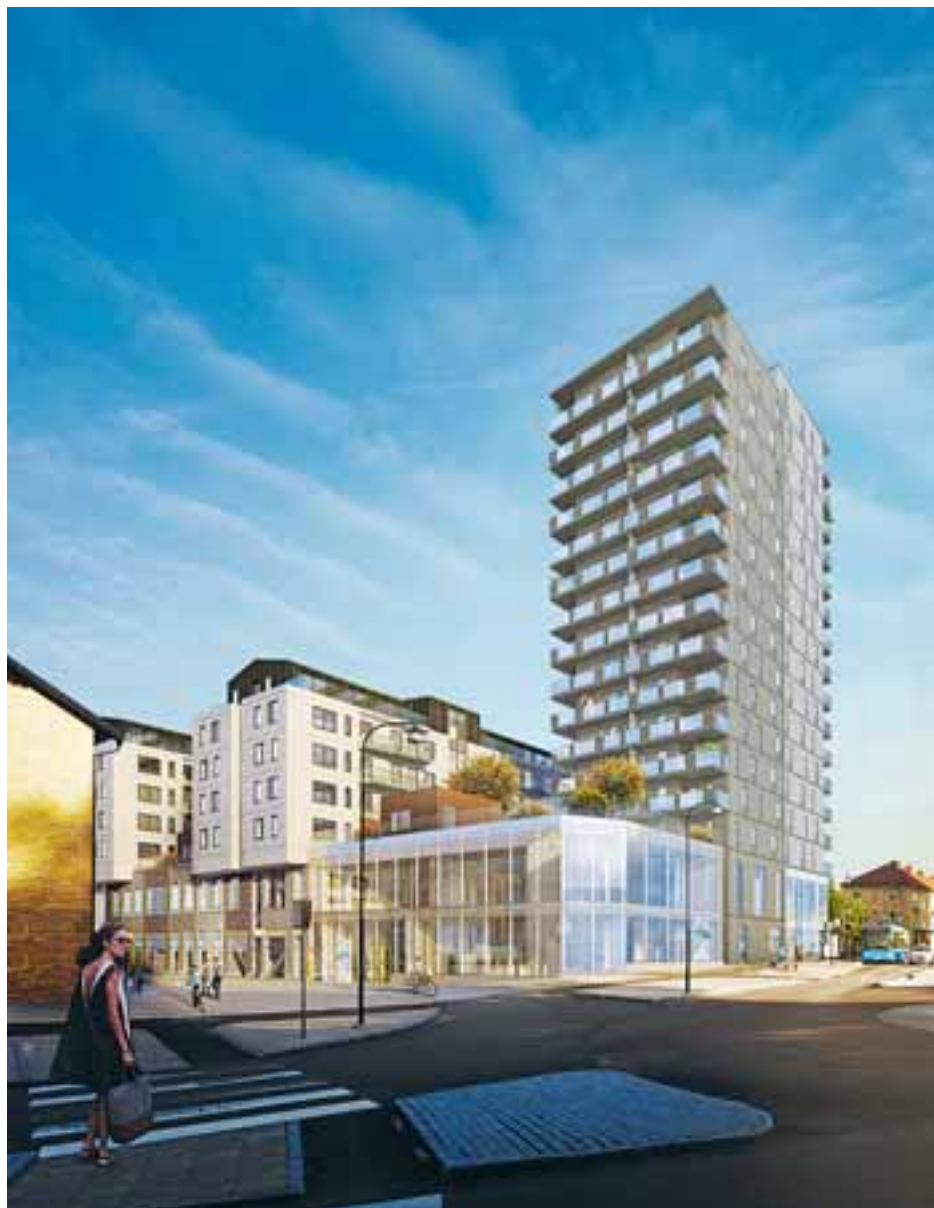
Det är som mötesplats människor emellan som det nya stadsbiblioteket kommer att få sin främsta funktion och betydelse.