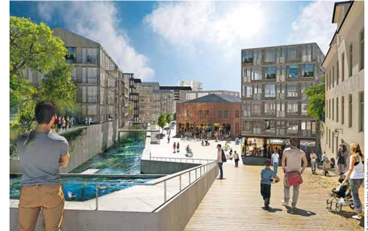
Forsetorget är arbetsnamnet på den plats som är starkast präglad av industrihistorien och kan bli en given mötesplats för kulturella och kommersiella verksamheter. Bilden visar att Mölndalsån har en central roll i den nya stadsdelen.

Just nu pågår rivnings- och saneringsarbeten samtidigt som byggnader som ska bevaras förses med provisoriska tak. Nästa år förväntas en första av minst tre detaljplaner