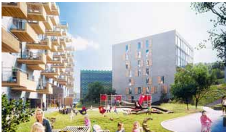
Krokslätts Fabriker Söder är ett kanonläge för nya bostäder. Bara två kilometer från Mölndals centrum och tre kilometer till Liseberg, alldeles intill naturreservatet Safjället.

hetsaspekten i fråga om hållbart resande och möjligheter för de boende att med bil- och cykelpool kunna resa smart. Något som underlättar är givetvis den omedelbara närheten till kollektivtrafik, framförallt spårvagn.