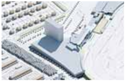
Illustration: Palmeby &amp; Elfvig Arkitekt