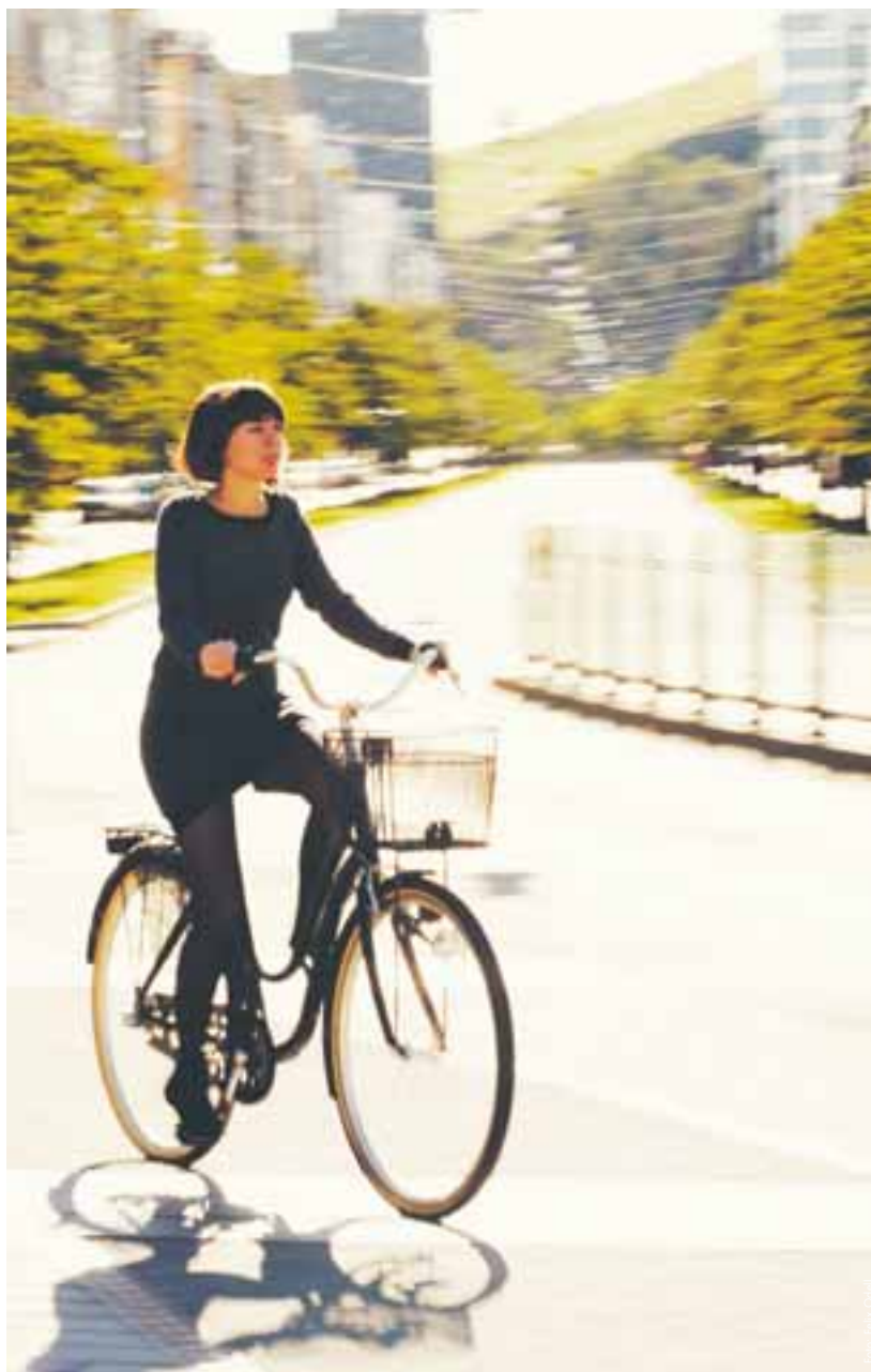
Boende i Mölndal har vill leva i en gemytlig och trevlig stadsmiljö.

OCKSÅ FÖR GALLERIAN som är inspirerad av en småskalig kvartersuppdelning i tegel, puts, corténstål med en insida med inslag av trä har inputen från dialogarbetet varit ledord. Den ska kännas inbjudande och gemytligt. Affärer, fik och restauranger har därför entréer mot utsidan och inomhus kommer man att kunna vandra som mellan små olika kvarter.